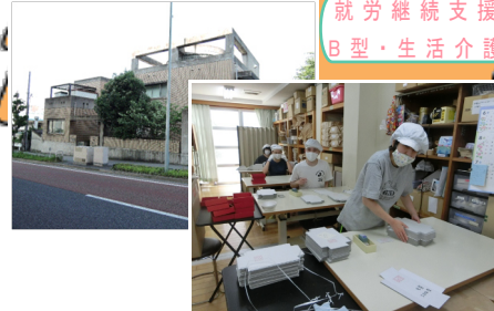
就労継続支援 B型・生活介護