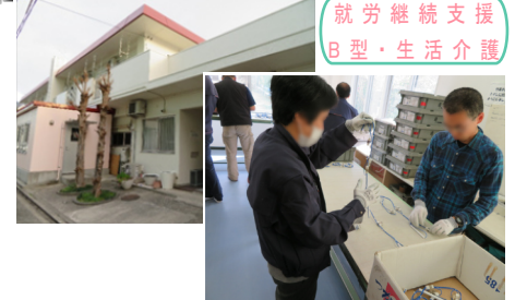
就労継続支援 B型・生活介護