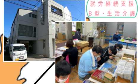
就労継続支援 B型・生活介護