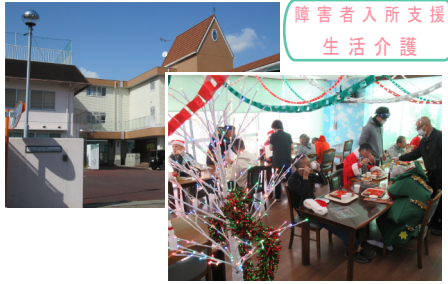
障害者入所支援 生活介護