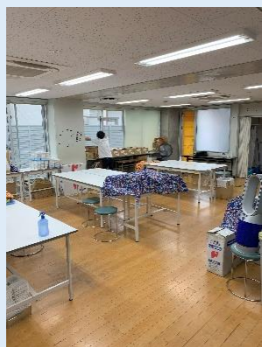
1階 活動室 (生活介護)