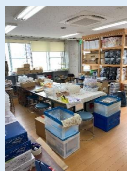
3階 作業室 (就労継続支援B型)