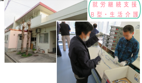
就労継続支援 B型・生活介護