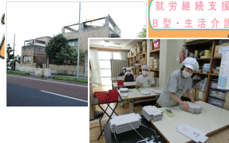
就労継続支援 B型・生活介護