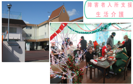
障害者入所支援 生活介護